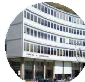
CAMERA DI COMMERCIO

All Junior surgeons and residents are invited to the Junior MD Lunch. The intent of this luncheon is to share ideas and experiences in a convivial and informal context with several Senior thoracic surgeons, which will be announced on October 10th. Registration is required at the time of registration, for a maximum of 25 participants.