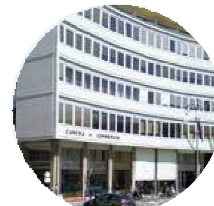
CAMERA DI COMMERCIO