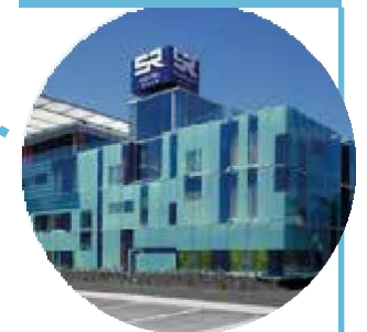
HOTEL S. RANIERI