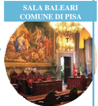
SALA BALEARI COMUNE DI PISA