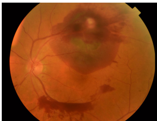
图1 视网膜大动脉瘤

患者因“左眼视物模糊2个月余”到湖北医药学院附属襄阳市第一人民医院眼科就诊,完善眼底检查可见:左眼颞上方视网膜约2、3级分支静脉交叉处血管瘤,呈现黄色囊腔样改变,周围约5 PD大小的视网膜下出血,累积黄斑区。颞下方可见横片状视网膜前出血(图1)。完善眼底血管荧光造影检查(图2),患者确诊为视网膜大动脉瘤,给予激光光凝瘤体治疗,出血逐渐吸收,患者视力恢复至0.8。